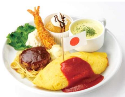
大人も食べられるお子様ランチ

期 間：2016年3月19日(土)～4月24日(日) 計37日間 場 所：横浜赤レンガ倉庫 1号館、2号館 内 容：横浜赤レンガ倉庫では、『FLOWER GARDEN 2016』と連動した『Red Brick Easter』を実施。各店舗では、卵を使ったメニューやお花をモチーフにした雑貨を多数ご用意します。