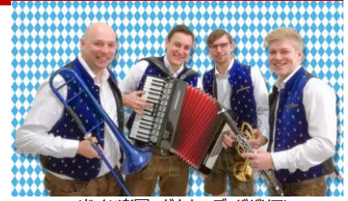
<ドイツ楽団 ガウキーズ ババリア>