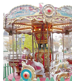
<昨年大好評 メリーゴーランド>

今年4月にリニューアルオープン 15周年を迎えた横浜赤レンガ倉庫では、4月28日（金）から5月7日（日）までの計10日間、横浜赤レンガ倉庫イベント広場と赤レンガパークにてドイツの春祭りを再現したイベント『Yokohama Frühlings Fest 2017』（入場無料）を開催します。開催初日の28日（金）は17時よりオープンし、17時30分から特設テントにてオープニングセレモニーを行います。セレモニーではドイツ楽団の演奏に合わせて乾杯し、リニューアル 15周年の感謝の気持ちを記したリボン2000個が舞い降りる演出で会場を華やかに彩り、イベントのスタートを盛大に祝います。オープニングセレモニーにお越しいただいたお客様にイベントの思い出としてリボンをお持ち帰りいただけます。