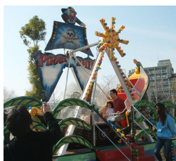
<今年初登場 海賊船>