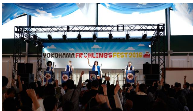
<昨年開催時の様子>