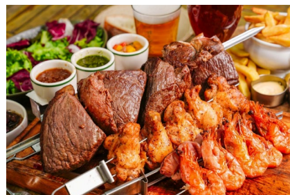
<食べ放題メニュー イメージ>