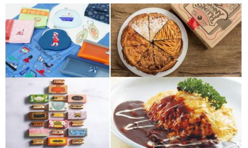
<対象店舗商品 一例>

ご来館当日に雨が降っている場合に限り、横浜赤レンガ倉庫2号館1階インフォメーションにて館内の対象店舗（約45店舗）にて店舗ごとの“お得な”サービスが受けられるクーポンをプレゼント。詳細は、以下に記載しているキャンペーン概要欄をご確認ください。