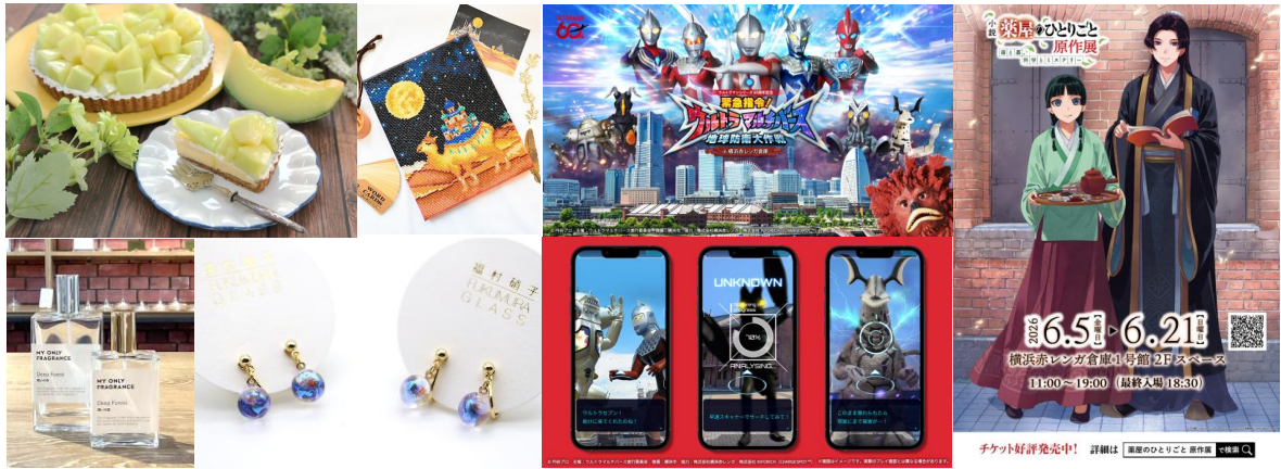
<横浜赤レンガ倉庫 グッズ・メニュー イベントイメージ>

横浜赤レンガ倉庫では、1号館・2号館内の飲食・物販店舗にて、5月～6月の梅雨時期に向けて揃えたいレイングッズやアイテム、気分を上げてくれるアクセサリーのほか、旬の果物をつかったスイーツ、雨の日でも館内やご自宅で楽しめる体験コンテンツなどを展開いたします。