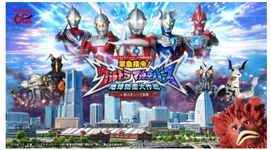
イベントキービジュアル

公式サイト： https://styly.cc/ultra-multiverse/