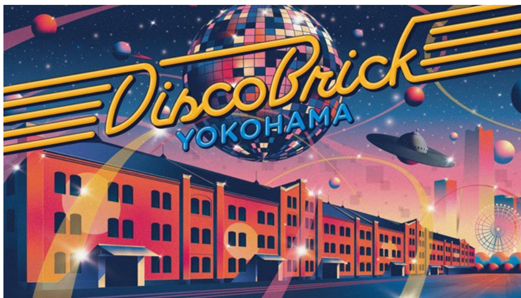
『Disco Brick YOKOHAMA』キービジュアル

横浜赤レンガ倉庫では、2026年8月8日(土)から8月23日(日)の計16日間、横浜赤レンガ倉庫イベント広場にて、1970年代から1980年代にかけて世界的にブームとなった「ディスコ」をイメージした音楽イベント『Disco Brick YOKOHAMA』を初開催します。