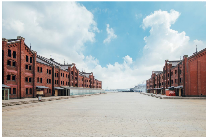
横浜赤レンガ倉庫 外観

また、2022年12月のリニューアルをきっかけに、サステナビリティへの取り組みを強化しています。2023年11月には、横浜市SDGs認証制度「Y-SDGs」における最上位『Supreme』を取得するなど、地球環境と横浜赤レンガ倉庫に訪れるお客様が重要なステークホルダーであると認識し、事業活動を通じて持続可能な社会の実現を目指します。