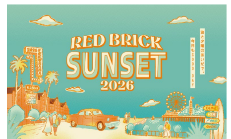
『Red Brick Sunset 2026』キービジュアル

近年は、「タイ」「ラテンアメリカ」「地中海」など、世界各地の人気リゾート地をテーマに開催。今年は、アメリカ西海岸の人気リゾート地「サンタモニカ」をテーマとしました。暑い日々の中で少しでも涼を感じていただけるよう、会場はサンタモニカの中でも「サンセットビーチ」をイメージし、現地の洗練された街並みや、“レトロ可愛い”ポップでカラフルな世界観を表現します。