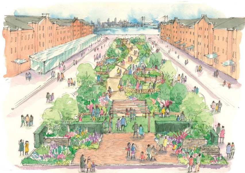
『NAKANIWA ~FLOWER GARDEN 15th anniversary~』イメージパース

2017年4月1日(土)~4月23日(日) 入場無料 ※3月31日(金)はプレビューを予定