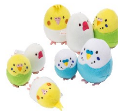
たまご型ココロコトのお手玉(小)(中) 各¥734~¥950 (税込) 【店舗】Plame Collome(2号館2階)