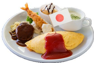
大人も食べられるお子様ランチ ¥1,274 (税込) 【店舗】横浜たちばな亭(2号館1階)

期 間：2017年3月17日(金)~4月23日(日) 計38日間 場 所：横浜赤レンガ倉庫 1 号館、2 号館 内 容：横浜赤レンガ倉庫では、館内キャンペーン「Red Brick Easter」を実施。各店舗にて、イースターの象徴である「卵」を使ったメニューや、「うさぎ」をモチーフにした商品をご用意します。また、イースター関連のワークショップも実施予定です。