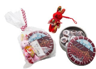
赤レンガあめ缶&チリメンうさぎストラップ ¥993 (税込) 【店舗】チャイハネ(2号館2階)