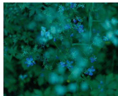
田尾沙織 写真作品