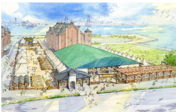
<会場イメージパース>

2017年9月29日(金) ~ 10月15日(日) 計17日間 ※9月29日はオープニングセレモニーを予定