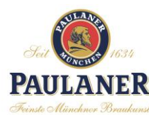
<ミュンヘン6大醸造所ロゴ>

横浜赤レンガ倉庫では、9月29日(金)から10月15日(日)までの計17日間、横浜の秋の風物詩『横浜オクトーバーフェスト2017』を横浜赤レンガ倉庫イベント広場にて開催します。