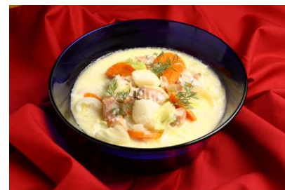
魚介のグラタンフェネル風味 ¥1,836（税込）