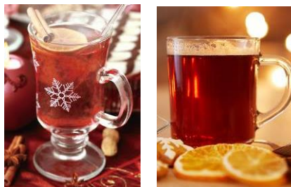
(グルューワイン イメージ)

ドイツのクリスマスマーケットに欠かせない飲み物といえば、「グルューワイン」です。グルューワインを飲みながらマーケットで買い物したり、仲間と会話することも楽しみ方の一つです。今年は、約20種類のグルューワインをヒュッテで販売いたします。自分好みの味を探してみてくださいはいかがでしょうか。