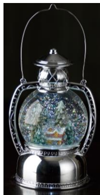
ランタンスノードーム ¥4,860（税込）