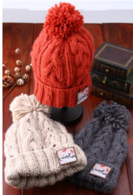
KEFP ON Knit Watch 各¥3,888（税込）