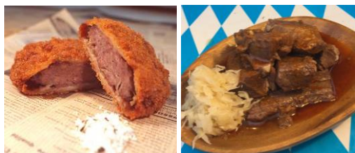
(ジビエ料理 イメージ)