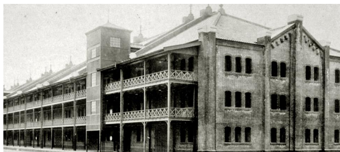
<創建時の1号館（横浜市港湾局蔵）>