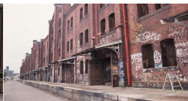
<落書きされた2号館>