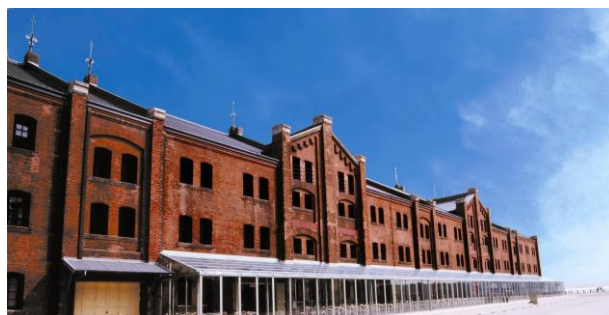
<現在の横浜赤レンガ倉庫（2号館）>

横浜赤レンガ倉庫では、文化・商業施設として2002年にリニューアルオープンし、今年で開館15周年を迎えたことを記念し、2017年11月から2018年3月までの5カ月間、毎月15日の計5回、横浜赤レンガ倉庫と横浜を巡る歴史ガイドツアーを実施します。