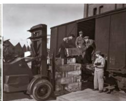
<接収・荷役赤煉瓦前>