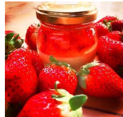
ブーケ ストロベリープリン ¥480 (税込)