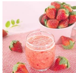
果汁工房 果琳 果肉ゴロゴロいちごジュース ¥500 (税込)