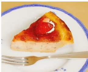
ガトーよこはま イチゴチーズケーキ ¥480 (税込)