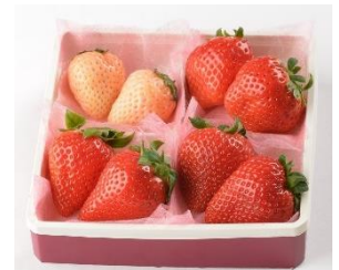
横浜水信 4種食べ比べセット ¥2,000 (税込)