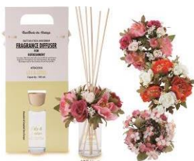
フレグランス・ディフューザー ¥1,080(税込) フラワーリング ¥648(税込)