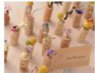
コルクドライ 各¥500(税込)

エディブルフラワーと果実酒を楽しむフォトジェニックなカクテル。ノンアルコールでの提供も可能。