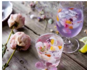
お花のカクテル 各¥800(税込)

エディブルフラワーと果実酒を楽しむフォトジェニックなカクテル。ノンアルコールでの提供も可能。