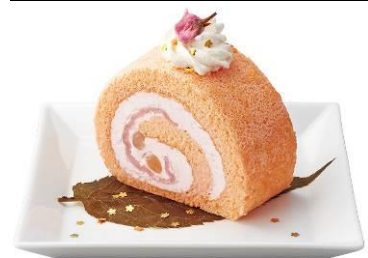
桜と餅の金箔ロールケーキ ¥745(税込)