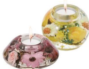
アンティーク・フラワー・キャンドルホルダー 各¥3,780(税込)