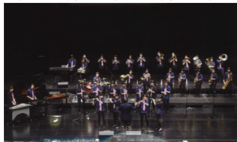
横浜市立港中学校吹奏楽部