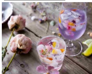
お花のカクテル 各¥800 (税込)

エディブルフラワーと果実酒を楽しむフォトジェニックなカクテル。ノンアルコールでの提供も可能。