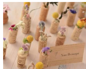
コルクドライ 各¥500 (税込)

エディブルフラワーと果実酒を楽しむフォトジェニックなカクテル。ノンアルコールでの提供も可能。