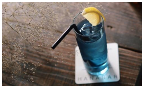
ウェルカムドリンク イメージ

横浜赤レンガ倉庫は、3月31日(土)から4月22日(日)までの計23日間、14,200株の草花で春の訪れを演出する『FLOWER GARDEN 2018』を開催。開催前日の3月30日(金) 11時より会場エントランスにて、オープニングセレモニー並びにプレスレビューを実施いたします。