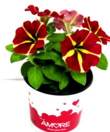
ペチュニア アモーレ