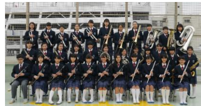
横浜市立港中学校

創部 60 年以上の歴史があり、東関東マーチング大会で 3 年連続金賞を受賞している有名校。最近ではジャズとマーチングを中心に、元町商店街・中華街のパレードや大さん橋での豪華客船見送り演奏、横濱ジャズプロムナードでのライブなど、地元ヨコハマを盛り上げる活動をしています。一昨年は「東日本大震災・復興支援の会」から推薦を受け、石巻・仙台で演奏も実施。「地域で愛されるバンド」、「明るく元気で一生懸命」なパフォーマンスを目指しています。