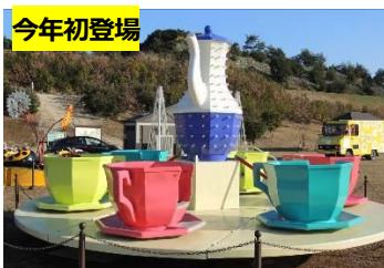
今年初登場 <コーヒーカップ> 食器のコーヒーカップを モチーフとした乗り物