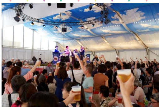
<過去開催時の様子>