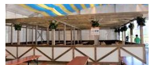
<ファミリーエリア>