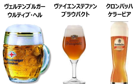
<日本初上陸ビール>

横浜赤レンガ倉庫は、4月27日（金）から5月6日（日）までの計10日間、横浜赤レンガ倉庫イベント広場と赤レンガパークにてドイツの春祭りを再現したイベント『ヨコハマ フリュールィングス フェスト 2018』を開催いたします。開催初日の27日（金）の16：00から特設テントにてオープニングセレモニーおよびプレスプレビューを実施。なお、イベント初日となる27日（金）は、プレミアムフライデーのため特別に15：00から会場をオープンいたします。