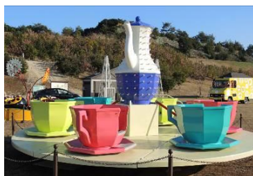
<今年初登場 コーヒーカップ>