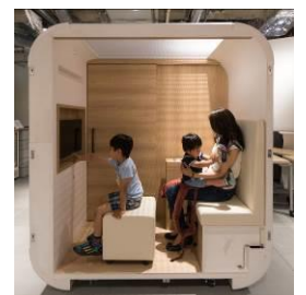
<完全個室の授乳室 mamaro>