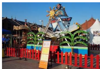
<海賊船> 振り子の動きで上下にスイングする スリル溢れる乗り物