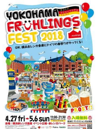
イメージビジュアル