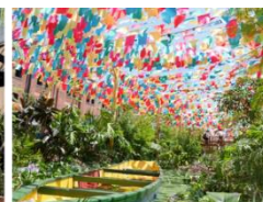
<イベント過去画像>