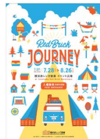
<イベント広告ビジュアル>