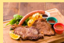
ミートグリルプレート

コンセプトは、“世界を旅するキャンピングカー & アウトドアスタイルで世界の味”。肉×アウトドアスタイル×世界の味をベースに、横浜赤レンガ倉庫の旅を盛り上げます。