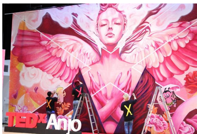
<過去のライブペインティングの様子>

横浜赤レンガ倉庫では、2018年7月28日(土)から8月26日(日)までの計30日間、イベント広場にて夏の旅行をテーマとした夏季限定イベント『Red Brick JOURNEY』を開催。開催前日の7月27日(金)11時より会場エントランスにて、 オープニングセレモニー並びにプレスプレビューを実施いたします。