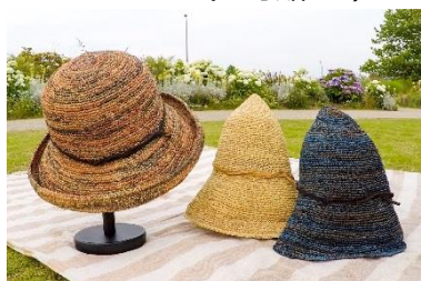
UV CUT ラフィアセーラー 各¥12,960 (税込)