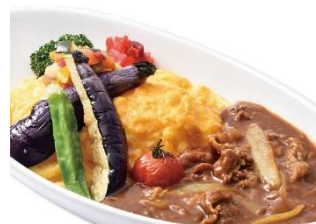
横浜赤レンガ倉庫限定 1日30食限定 夏野菜とビーフのオムカレー ¥1,166 (税込)

※『誕生30周年記念 ウォーリーをさがせ!展』に関しては特設サイト ( http://wally30.jp/ ) をご覧ください。