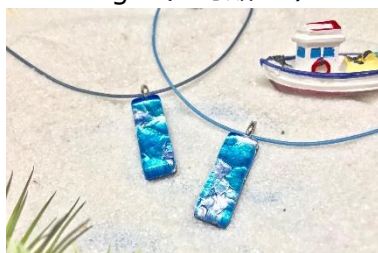
横浜赤レンガ倉庫限定 期間中50個限定 ムラーノガラスペンダント ピアストリーネ カプリ 各¥2,980 (税込)