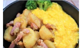
ホッペルポッペル〜農夫のオムレツ〜

パスタ生地で豚肉とほうれん草を包み込んだ南ドイツの伝統料理。特製トマトオリブソースで。