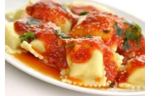
トマトの南ドイツミートパスタ包み

カーヴルスト、フランクフルト、白ソーセージに盛り合わせ限定ソーセージ(ポッケヴルスト)が付いたドイツソーセージ豪華盛り合わせです。