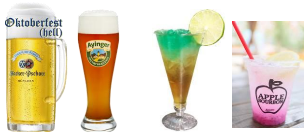
<日本初上陸ビール>