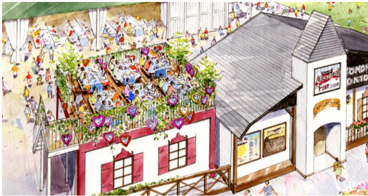
<屋上テラス席 イメージ>

2018年9月28日（金）～10月14日（日）計17日間 ※9月28日はプレスプレビューを実施予定