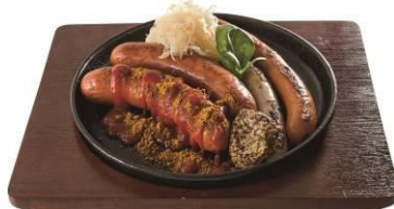
ソーセージの盛り合わせ

カーヴルスト、フランクフルト、白ソーセージに盛り合わせ限定ソーセージ(ポッケヴルスト)が付いたドイツソーセージ豪華盛り合わせです。