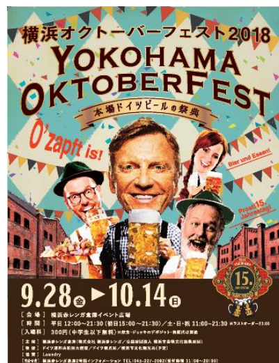
<イベント告知ビジュアル>