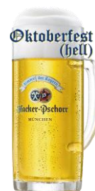
<日本初上陸ビール>