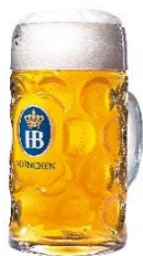
ホフブロイ (1589年創立)

かつてバイエルン国王の為に作られたビールとして由緒ある醸造所。本場オクトーバーフェストでは、1万席を超える最大級のテントを構築、絶大な人気を誇るまさに"王様のビール"。