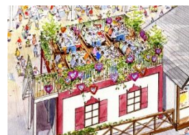
テラス席 イメージ

【第1会場内テラス席 (64席)】 開放的なテラス席を今年初めて第1会場に設置。 メンテナンスの中とは異なる落ち着いた雰囲気が楽しめます。