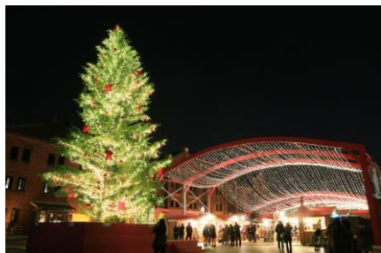
<昨年のツリーの様子>

クリスマスツリーの装飾は、花を使って思いを結ぶサービスを展開するフラワーショップ「サンジオリディアフラワーズ ザ・デコレーター」がプロデュース。ゴールドを基調としたクリスマスカラーの装飾にグラデーションを加えることで、温かみのある光の中に華美さを演出。また、ヒュッテ（木の小屋）の屋根の人形装飾は、ドイツから輸入し、昨年より数を増やすことで、本場ドイツのクリスマスマーケットの雰囲気を醸成します。