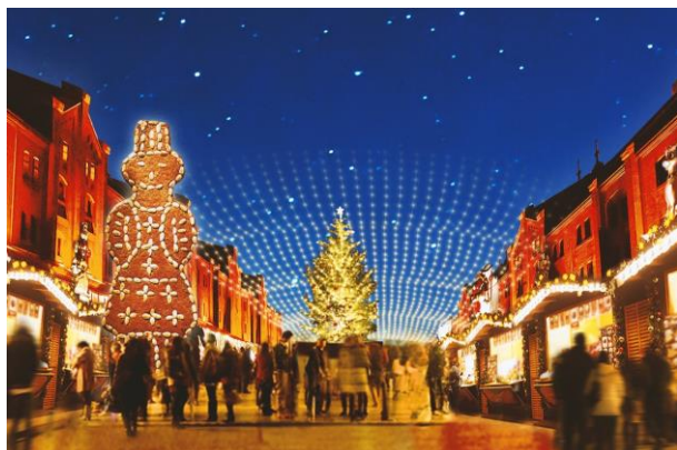
<メインビジュアル>

横浜赤レンガ倉庫では、11月23日(金・祝)から12月25日(火)までの計33日間、昨年80万人近く*の方にご来場いただいた『クリスマスマーケット in 横浜赤レンガ倉庫』をイベント広場で開催します。*横浜赤レンガ倉庫2号館の来館者数より