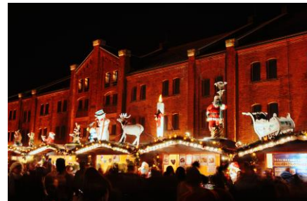
<昨年のヒュッテの上の人形装飾>