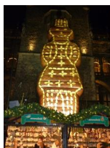
<アーヘンのクリスマスマーケットの名物“巨大ジンジャーブレッドマン型プリンテン人形”>