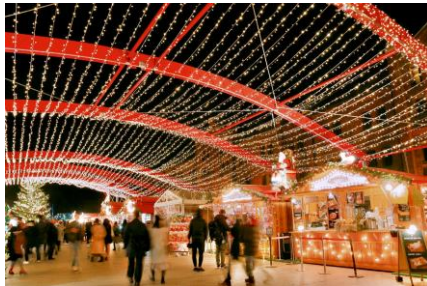
<昨年のイルミネーションの様子>