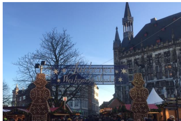
<アーヘンのクリスマスマーケット>