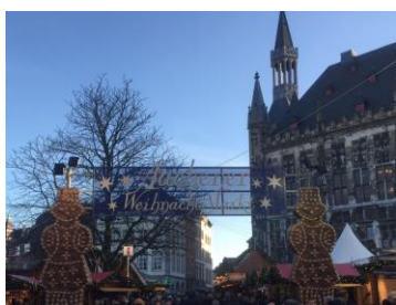
<アーヘンのクリスマスマーケットの様子>

ドイツ・アーヘンのクリスマスマーケットは、ご当地スイーツのスパイス入りクッキー「アーヘナープリンテン」をモチーフにした、巨大ジンジャーブレッドマン型のプリンテン人形が名物。本場の世界感を創出するために、アーヘンのクリスマスマーケットと同様に、現地で制作された同じ型の高さ3mのプリンテン人形をエントランスに設置し、お客様をお出迎えます。また、「アーヘナープリンテン」も会場内で販売。日本ではなかなか食べることができないクッキーをお土産にしてみたいはいかがでしょうか。