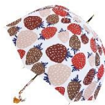
和傘屋 北斎グラフィック (2号館 2階) 丸屋根深張傘-苺 ¥4,968