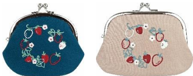
Souvenir Gallery YOKOHAMA (2号館 2階) Strawberry がま口・親子がま口 (数量限定) がま口 ¥1,836 親子がま口 ¥3,456

横浜赤レンガ倉庫 1号館・2号館のカフェ・レストラン・物販店舗でも、いちごにちなんだメニューやアイテムをイベント会期中に販売。