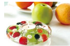
ヨコハマズベスト赤レンガショップ ダニエル (1号館 1階) フルーティー・キャンドルホルダー ¥3,240