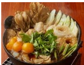
<秋田県大館市直送！ 名物きりたんぼ鍋>

900円 きりたんぼ鍋発祥の地！秋田県大館市から具材すべてを直送しました。(比内地鶏スープ濃口醤油)