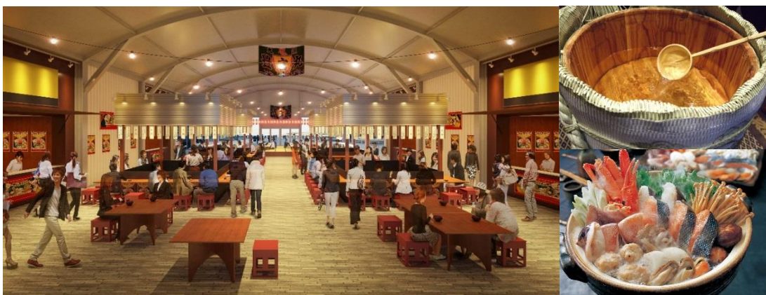
<会場・菰樽・鍋イメージ>

横浜赤レンガ倉庫では、2019年1月18日(金) から27日(日)までの計10日間、冬のフードフェスティバル『酒処 鍋小屋 2019』をイベント広場で開催します。オープンに先駆け、開催初日の1月18日(金) 11:40よりオープニングセレモニーを実施いたします。