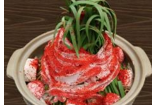
<激辛！坦々豚スタミナ鍋>

1,980円 (一人前) たっぷりの唐辛子、ニンニク、ニラ、もやしを特製坦々ごまダレで仕上げた元気が出る激辛スタミナ鍋！