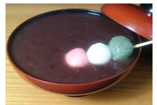
<おしるこ～花見だんご入～>

300円 小豆をじっくりと炊きあげ濃厚な旨みを引き出し絶妙な甘みを加え、花見だんご風の白玉を添えました。