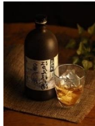
【白雪 江戸元禄の酒】

長き歴史を紐解いた秘伝の酒。1550年創業の「白雪」の元禄時代当時の酒を再現した濃醇甘口のお酒。