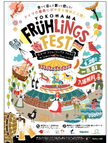
<イメージビジュアル>