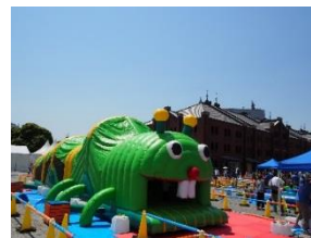
〈キャタピラーふわふわ〉

スライダーや障害物など仕掛け が盛りだくさんの巨大キャタピ ラーの内部を冒険します。