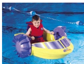
〈ラグーンウォーターパーク〉