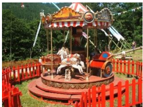
〈メリーゴーランド〉