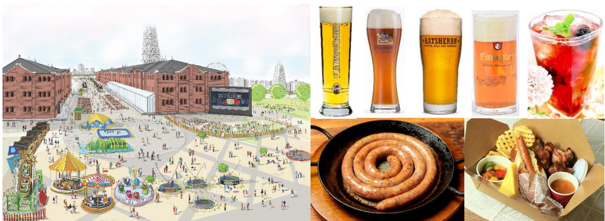
<会場イメージパース・フード・ドリンク>

4月26日（金）～5月6日（月・祝）計11日間 入場無料※26日（金）のみ15:00オープン