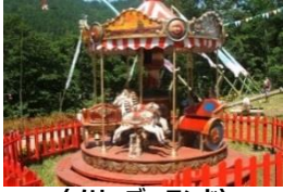
〈メリーゴーランド〉