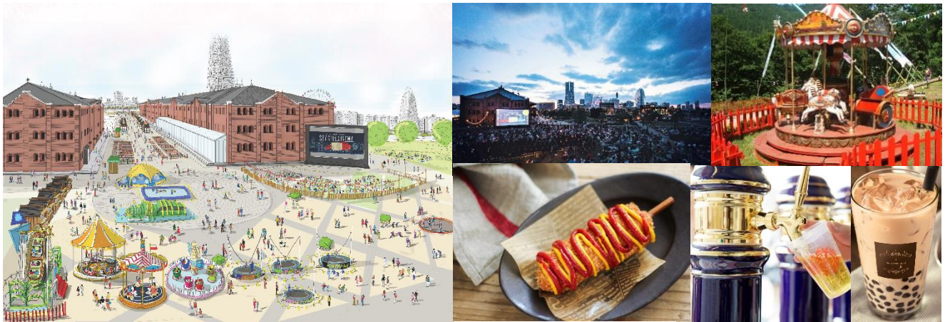
<会場イメージ・野外シアター・メリーゴーランド・フード・ドリンク>

横浜赤レンガ倉庫では、4月26日（金）から5月6日（月・休）までの計11日間、横浜赤レンガ倉庫イベント広場と赤レンガパークにてドイツの春祭りを再現した『Yokohama Frühlings Fest 2019』を開催します。『Frühlings Fest』とは、春の訪れをお祝いするドイツのお祭りで、ビール祭りと移動遊園地がセットになっており、ドイツでは家族や仲間とともに春の一日を楽しむことが風物詩です。