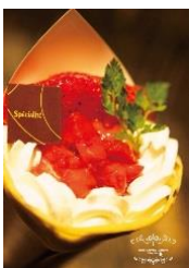
たっぷりいちごのクレープ

たっぷりいちごを使用した、贅沢なクレープは、もちもち生地と生クリームの相性が抜群です。口に入れた時の至福の時をご堪能ください。