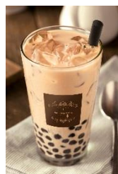
タピオカロイヤル ミルクティー

たっぷりいちごを使用した、贅沢なクレープは、もちもち生地と生クリームの相性が抜群です。口に入れた時の至福の時をご堪能ください。