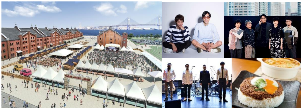
<イベント会場イメージ・出演アーティスト・出店カレーイメージ>

株式会社横浜赤レンガは株式会社ソニー・ミュージックエンタテインメントと株式会社 Zepp ライブとともに、2019年6月29日（土）から6月30日（日）の計2日間、横浜赤レンガ倉庫イベント広場にて『CURRY&MUSIC JAPAN 2019』を初開催します。