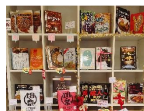
浅草カレーランド

日本全国のご当地のレトルトカレーだけを扱った専門店『浅草カレーランド』が期間限定で横浜赤レンガ倉庫に出張営業します。オーナー夫婦が実際に自分たちの口で味を確かめたものしか置いていないという拘りの品揃えです。イベントのお土産に購入してみたいかでしょうか。