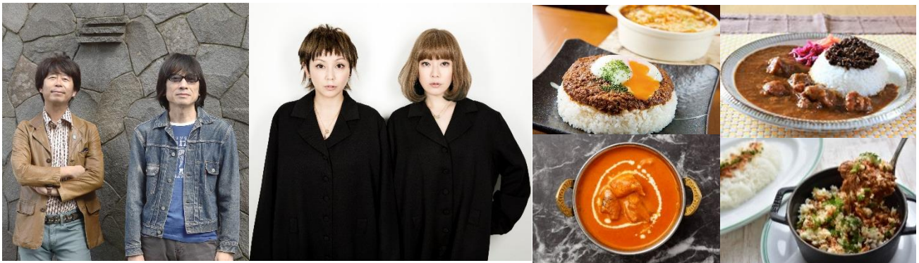
<真心ブラザーズ・PUFFY・販売カレーイメージ>

< 2019年6月29日(土)～30日(日) 28日(金)プレオープン※28日のみ入場無料 >