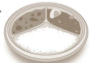
<専用プレート イメージ>