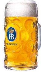
ホフブローイ オクトーバーフェストビア 本場ドイツオクトーバーフェストで飲まれる至高のビール！苦みとコクの絶妙なバランスが特徴。