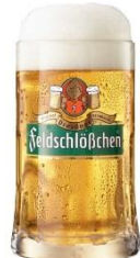
【日本初上陸】 フェルトシュレーヘン ピルスナービール

しっかりとした見た目と、それに伴う香りとボディ。ゆっくりと飲み続けられる秋の夜長にぴったりなビール。