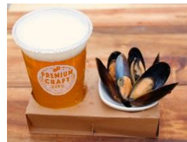
リトルピアセット 平日、14時～17時限定で、ミニビールとおつまみがセットになったメニューを各店で販売。気軽に飲みたい方にぴったりです。