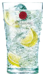
タンカレージントニック 【第2会場メニュー】 高品質な4種類のポタニカルを使用したプレミアムジンはシャープな味わいのジントニックにピッタリです。