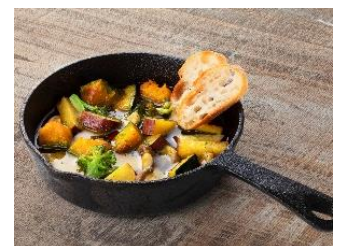
秋野菜のアヒージョ (バケット付き) 【第2会場メニュー】