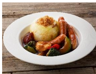
丸ごと玉ねぎとゴロゴロ野菜のソーセージジャーシュ