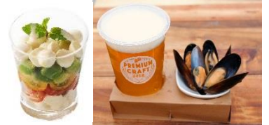
<野菜メニュー・リトルビアセット>

秋野菜を使用したメニューやポトフやアヒージョ等、今年は野菜料理が充実。気分に合わせて、様々なメニューの中からビールに合う一品をお選びいただけます。さらに、平日の時間限定でミニビールとおつまみがセットになった「リトルビアセット」を販売。気軽に少しずつ飲みたい方や沢山の種類を楽しみたいという方にぴったりです。