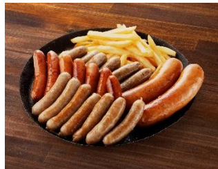
ソーセージランド 22本盛り (フライドポテト付き)