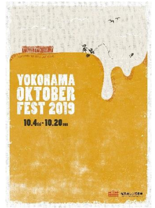
<イベントメインビジュアル>