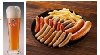
<初上陸ビール・ソーセージ>

ドイツで最も美しいエルベ渓谷に醸造所がある「フェルトシュレーヘン」や今年設立100年を迎える「エゲリア」など、日本初上陸のビールや、オクトーバーフェストのために作られた限定のフェストビア等、100種類以上のビールをご用意。また、メニューも本場感を感じいただけるよう、定番のソーセージやボリュームミーな肉料理等多彩なメニューを取り揃えます。