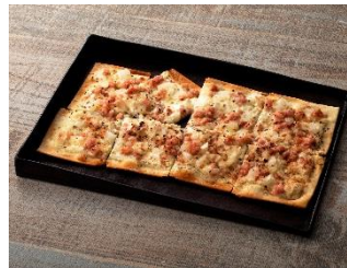
ドイツ風ピザ フラムクーヘン ベーコン