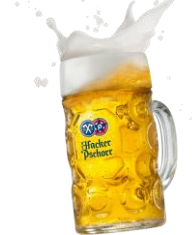
ハッカープショール オクトーバーフェストビア オクトーバーフェストで振舞われる特別なビール！この時期にしか味わえない逸品をココハマで味わえます。