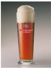
【日本初上陸】 エゲア メルツェン ツヴィツェル

しっかりとした見た目と、それに伴う香りとボディ。ゆっくりと飲み続けられる秋の夜長にぴったりなビール。