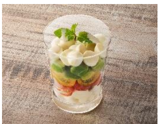
アボカド・トマト・モッツアレラの ミルフィーユサラダ（マスカルポーネ&ナッツソース）