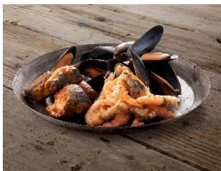
バルト風3種の シーフードプレート