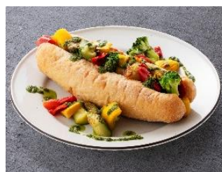
彩りベジタブルドッグ