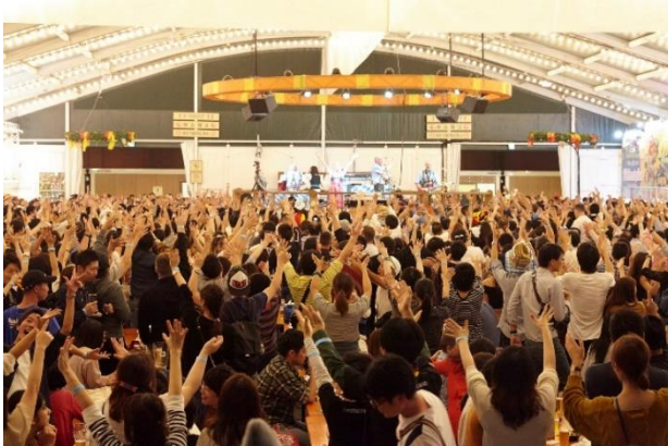
<横浜オクトーバーフェスト会場の様子>