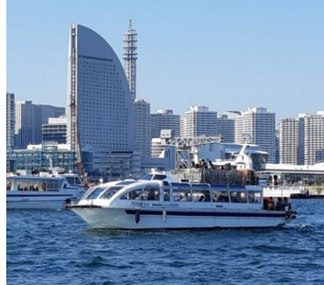
<横浜港クルーズ イメージ>

横浜赤レンガ倉庫では、10月4日（金）から10月20日（日）までの計17日間、横浜の秋の風物詩『横浜オクトーバーフェスト 2019』を横浜赤レンガ倉庫イベント広場にて開催します。