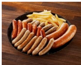
ソーセージランド (ジャーマンソーセージ 22本盛り)