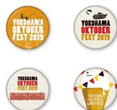
缶バッジ各種 各¥100 (税込)