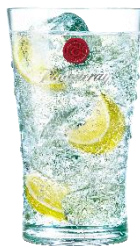
タンカレージントニック 【第2会場メニュー】 高品質な4種類のボタニカルを使用したプレミアムジンはシャープな味わいのジントニックにピッタリです。