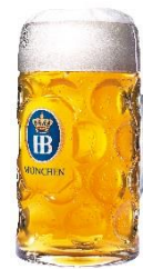
ホフブロー オクトーバーフェストビア 本場ドイツオクトーバーフェストで飲まれる至高のビール！苦みとコクの絶妙なバランスが特徴。