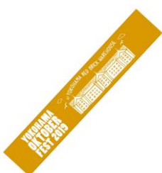
オリジナルマフラータオル ¥1,500 (税込)