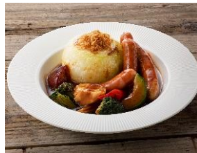
丸ごと玉ねぎとゴロゴロ野菜 のソーセージガーシュ