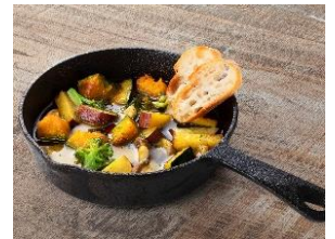
秋野菜のアヒージョ (バケット付き) 【第2会場メニュー】