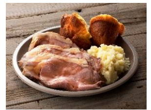
サンデーロースト (ビーフ) 【第2会場メニュー】