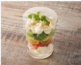
アボカド・モッツアレラ・2種トマトの ミルフィーユサラダ