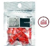
papabubble 横浜赤レンガ倉庫 オリジナルキャンディー ¥700 (税込)