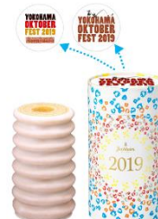
ユーハイム パウムクーヘントウム ¥1,350 (税込)