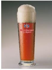
【日本初上陸】 エゲア メルツェン ツヴィッケル

しっかりとした見た目と、それに伴う香りとボディ。ゆっくりと飲み続けられる秋の夜長にぴったりなビール。