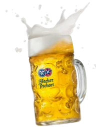
ハッカー・プショール オクトーバーフェストビア オクトーバーフェストで振舞われる特別なビール！この時期にしかな味わえない逸品をヨコハマで味わえます。