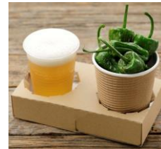
<販売メニュー一例>