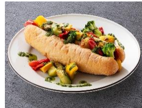
彩りベジタブルドッグ