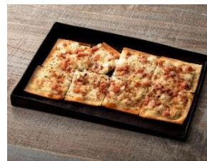
ドイツ風ピザ フラムクーヘン ベーコン