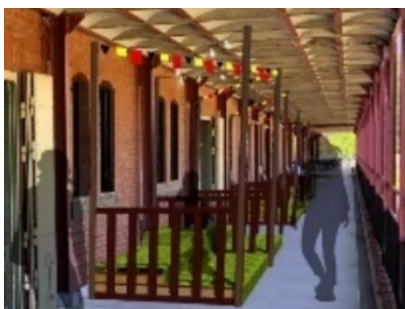
<芝生の飲食スペースイメージ>