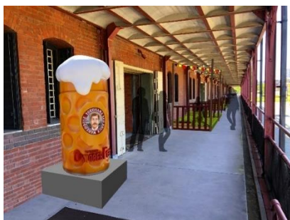
<ビールのオブジェと飲食スペース設置イメージ>