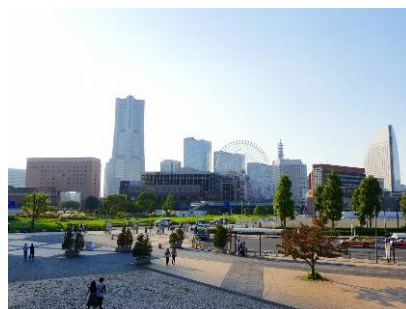
<バルコニーから一望できるみなとみらいの景色>