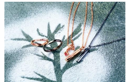
THE KISS (2号館1階) 2020クリスマス限定ジュエリー

文字盤の木がおしゃれな腕時計です。ペアウオッチにお勧めです。 ベルトにペアで刻印もいれちゃいましょう！ 各18,150円（税込）