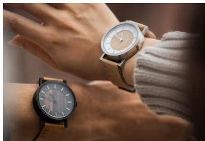
Hacoa DIRECT STORE (2号館2階) WATCH 2200

サンタは約2.5cm!ガラスのミニチュアを多数ご用意しております。 ちょっとしたギフトにもおすすめです。 1セット1,540円（税込）