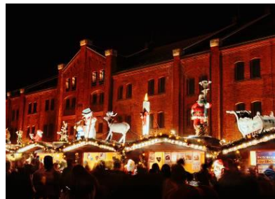
<ヒュッテ(木の小屋)上の人形>