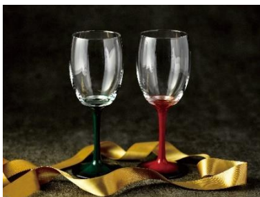
暮-KURASHI- (2号館2階) すいどうよ ワイングラス

緩やかな曲線を描く美しいフォルムのペアジュエリー。 どちらにも「永遠」を意味するダイヤモンドが輝きます。 リングペア29,700円（税込）、ネックレスペア33,000円（税込）