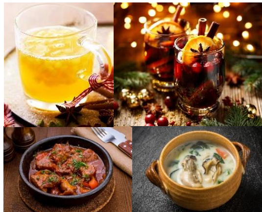
<提供メニュー※一部>

横浜赤レンガ倉庫は、12 月 4 日（金）～12 月 25 日（金）の計 22 日間、『Christmas Market in 横浜赤レンガ倉庫』を開催いたします。クリスマスマーケットは、1393 年にドイツ・フランクフルトで始まったと言われている、クリスマスの訪れを待つ“アドヴェント”の期間にクリスマス準備のショッピングを楽しむ催しです。開催地である横浜赤レンガ倉庫がドイツに所縁があることから、本場の雰囲気を感じられるクリスマスマーケットとして 2010 年から開催し、今回で 11 回目の実施となります。