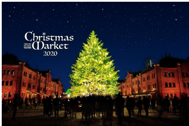
<メインビジュアル>

2020 年 12 月 4 日（金）～12 月 25 日（金）の計 22 日間開催