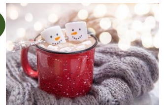
スノーマンココア 見た目も可愛いクリスマス限定商品♪ 700円