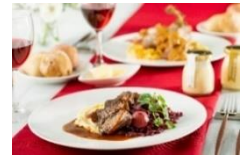
ザウアーブーテン(ドイツの牛肉煮込み)1,500円