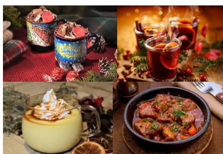
<提供メニュー※一部>