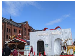
<“ギフトボックス”のゲートイメージ>