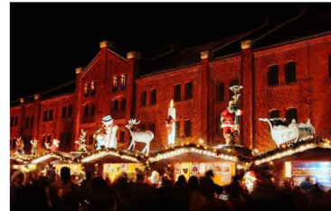
<ヒュッテ(木の小屋)上の人形イメージ>

会場入口には今年のコンセプトを象徴する、巨大な“ギフトボックス”のゲートがみなさまをお出迎え。またイベントのシンボルである高さ約10mの生木のクリスマスツリーには、ギフトをイメージしたリボンによる装飾と鮮やかな光が灯ります。ドイツ製ヒュッテ(木の小屋)の屋根の上には、ドイツから輸入したサンタ人形などのオブジェが装飾され、クリスマスマーケットの雰囲気をもより一層盛り上げます。