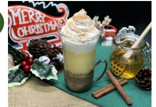
アイヤープンシュ クリスマスに欠かせないミルクセーキ風カクテルです。 600円