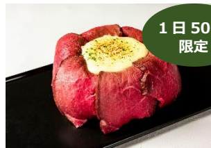
肉チーフンデュ チーズソースにディップして召し上がり！ 2,200円