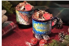
クリスマス マルティ ホットショコラドリンク (リンドール1個付き) 各700円

ファーストクラス機内食の絶品メニューも ファーストクラス機内食の監修・調理を手掛ける『ワールドフレーザー』の、“真空低温調理技術”を用いた高級レストランクオリティの柔らかく肉厚ビーフショートリブや限定メニューも要チェック。