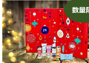
ドレスナーエッセンス アドベントカレンダー2021 日本交流160周年を記念して 2021年10月に日本初上陸! 9,900円