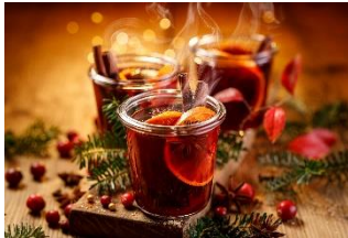
王様のホットワイン 3種のスパイス・フルーツを使った禁断のレシピ。 700円