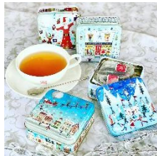
ウィンターワンダーランド クリスマス柄の可愛い缶に ティーバッグをアソートしました。 各1,500円