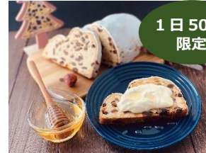
チーズクリームとはちみつシュトレン ドイツ伝統のパン菓子をチーズクリームでどうぞ！ 700円