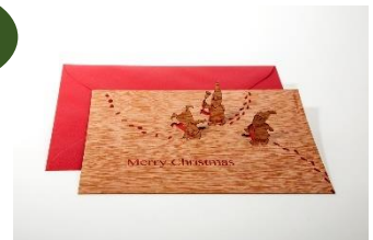
木製3Dポストカード 特殊加工を施したオーナメント にもなる木製ポストカード。 850円～