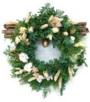
クリスマスリース 生の針葉樹やドライフラワーで作る、 こだわりのクリスマスリース。 3,300円～16,500円