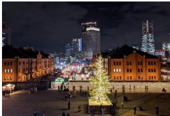
<シンボルのクリスマスツリーイメージ>