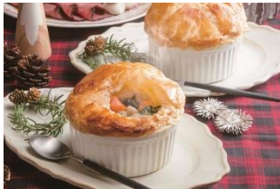
ゴロッとチキンのクリームポットパイ 熱々のクリームシチューをサクサクのパイ生地とお楽しみ下さい。 1,300円