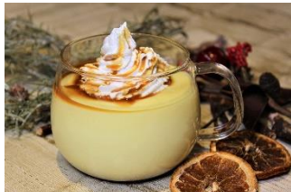
エッグノッグ 身も心も温まるクリスマスの新定番！ 600円