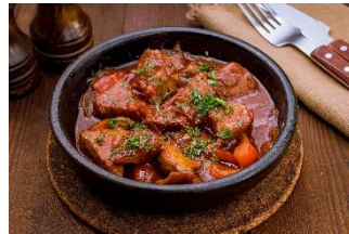
牛肉ゴロゴロビーフシチュー 柔らかい牛肉と野菜を煮込んだドイツ家庭の味。 1,200円