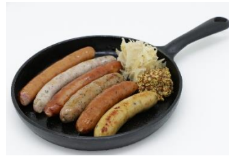
6種のソーセージをご注文で ソーセージ1本サービス