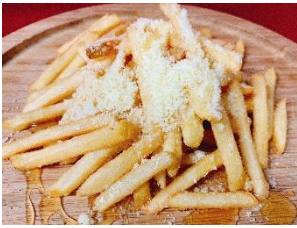
カリカリハニチーズポテトが 1.5倍に増量！