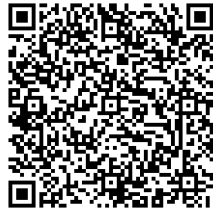
«iOS ダウンロード QR コード»

ダウンロード URL：(iOS) https://apps.apple.com/jp/app/横浜赤レンガ倉庫イベント公式アプリ/id1588908202 (Android) https://play.google.com/store/apps/details?id=jp.co.mcud.eventapp