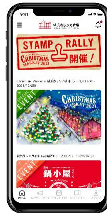
<アプリ画面イメージ>