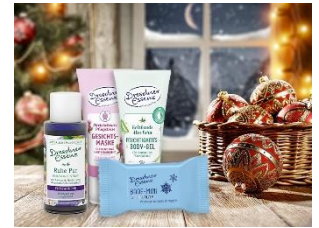
3,300円(税込)以上お買い上げの お客様にミニギフトプレゼント！ ※なくなり次第終了となります。