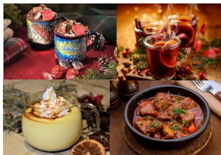
<提供メニュー※一部>