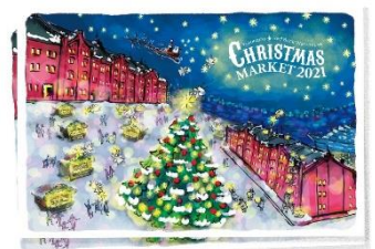
<ポストカードデザイン>