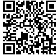
«Android ダウンロード QR コード»

※本アプリは iOS 及び Android スマートフォン専用サービスとなります。