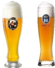
直輸入樽生ドイツビールが、 Sサイズの料金でMサイズに「サイズUP」！！