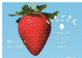
<佐賀県 いちごさん>