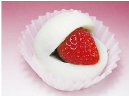
<浅草梅園> いちご大福／432円

会場にはいちごスイーツ・ドリンクや雑貨、さらにはアトラクションまで五感で楽しめる多彩な“いちご”が勢ぞろい。「浅草梅園」のいちご大福や新鮮ないちごの食べ比べセットが楽しめる「横浜水信」などの人気の定番メニューに加え、各期間の中で限定の店舗・メニューもありますので、期間ごとに訪れても新たな“いちご”の魅力に出会えます。