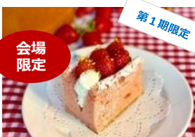
<馬車道十番館> いちごミルクシフォン／750円

〜いちごゼリーの装身具〜 ネットレス：各1,100円 リング：各990円 可愛くて美味しい小さないちごゼリーを 装身具にできたらうれしい！ そんなイメージでデザインしました。