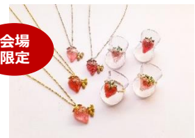
<秘密の苺 MICO E> gelée de fraise Bijoux

キャトルロール／864円 苺のダイスやクリーム、ジャムを使用した 異なる4種のプチロールを重ね、 華やかなデザートに。