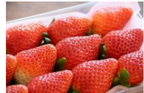
<銚田市 いばらきつす>