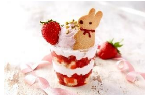
<YOKOHAMA BASHAMICHI ICE>

リサのストロベリーロイヤルミルクティー／660円 ガスパールのストロベリーラテ／660円