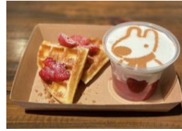
<Hawaiian waffle Merengue>