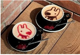
<GRANNY SMITH APPLE PIE&COFFEE>

リサのストロベリーロイヤルミルクティー／660円 ガスパールのストロベリーラテ／660円