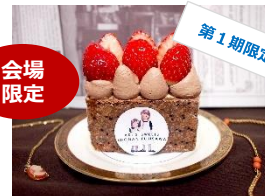
<湘南スイーツアキズ> あまおういちごとチョコの ナポレオンパイ／850円

snow-berry-ドーム／1,000円 イチゴをかまくらに見立てて ドーム状にしました。