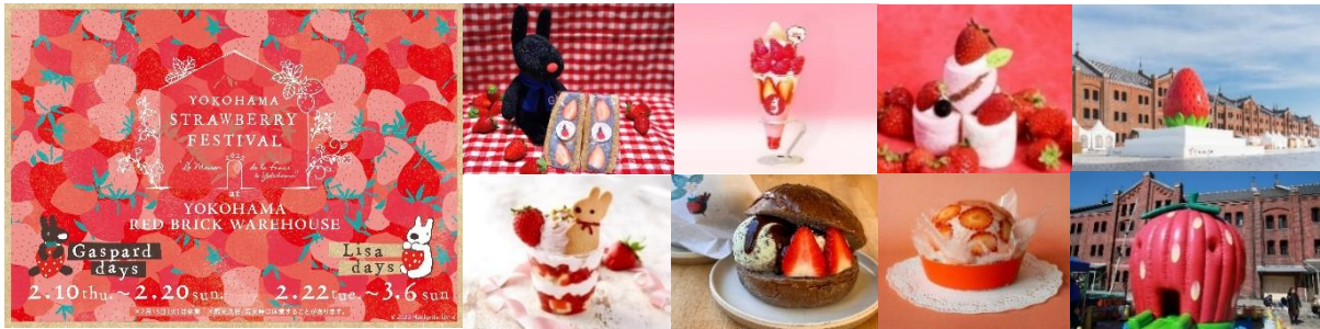
＜イベントキービジュアル＞

今年で9回目となる今回は、日本でも人気の高いフランス絵本のキャラクター“リサとガスパール”とのコラボレーションが実現し、ふたりと一緒に楽しめるいちごスイーツが登場。例年以上に多彩な“いちご”の魅力を堪能できる全期間計約30店舗のお店が、イベントを盛大に盛り上げます。