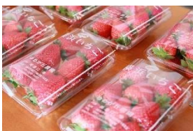
<横浜市の農家によるいちごの直売>

イベント会場では、横浜市の農家さんによるいちごの直売の他、様々な“ブランドいちご”を無料サンプリング！個性豊かないちごの中からお気に入りを見つけてみてください。