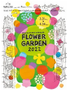
<イベントキービジュアル>

横浜赤レンガ倉庫は、3月31日(木)から4月24日(日)までの計25日間、“BRIGHT”をテーマに、明るく鮮やかな花々が横浜港を彩る『FLOWER GARDEN 2022』を開催します。※開催内容は予告なく変更になる場合がございます。