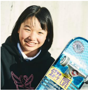
西矢 栞 (ニシヤ モミジ)