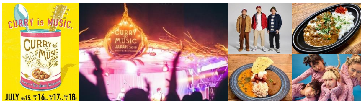
< イベントメインビジュアル・会場イメージ・出演アーティスト・出店カレーイメージ >

< 2022年7月16日(土)・17日(日)・18日(月・祝) 15日(金)プレオープン >