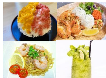
<提供メニューイメージ>

横浜赤レンガ倉庫では、2022年7月30日(土)から8月28日(日)の計30日間、横浜赤レンガ倉庫イベント広場にて『RED BRICK BEACH 2022』を開催します。※7月29日(金)プレオープン、メディア内覧会を予定