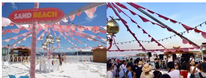
<会場イメージ ※過去開催の様子>