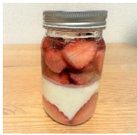
<vuke> あまりん&とちおとめのパンナコッタ ：1,300円

出店する計28店舗で、開催10周年を記念した横浜赤レンガ倉庫限定メニューを販売!ここだけの“特別ないちご”を是非お見逃しなく! ※10周年記念限定メニュー・グッズは、2月17日(金)～2月26日(日)の期間限定の提供となっております。