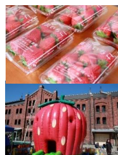
＜コンテンツイメージ＞