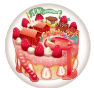
<横浜赤レンガ倉庫イベント公式アプリ>