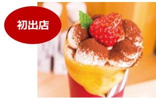
初出店 <Strawberry Crepe Kitchen> ティラミス×いちごのアイスクレープ ：1,100円

苺と相性抜群な練乳をバターと混ぜ込み、さらに「あまおう」をたっぷり入れてサンドしました。