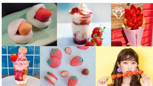
＜販売メニューイメージ＞