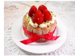
<湘南スイーツ アキズ> あまおういちごのシャルロット：900円 フランボワーズとチョコの2層になったムースをふわふわのビスキュイで飾った華やかなシャルロット。

10周年限定メニューとして、横浜赤レンガ倉庫の「レンガ色」をイメージして「ティラミス」とのコラボ!!