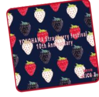
<秘密の苺 MICO E> イチゴタオルハンカチ：880円 ほどよい厚みで使いやすい日本製の王道イチゴ柄タオルハンカチ。