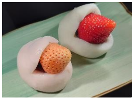
<浅草梅園> 紅白いちご大福：2個1セット1,000円 (ミルクベリー&とちあいか) 紅白いちご紅白大福で、おめでたい「いちご大福」に仕上げました。