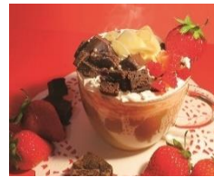
<STRAWBERRY CAFE LECKER> 贅沢苺のホットブラウニーショコラ(とちあいか) ：800円 黄金レシビのホットショコラに、贅沢苺と濃厚なブラウニーを加えた、美味しさ溶け合う特製ドリンク。