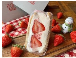
<フルーツサンド屋 SUN> あまおうの練乳バターサンド ：900円

埼玉県内限定生産のいちご「あまりん」を贅沢に使用し、ミルクパンナコッタと合わせた、10周年限定メニュー。