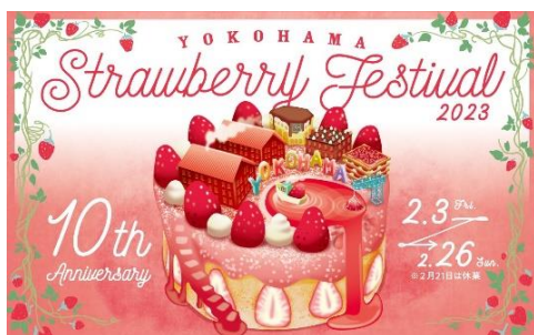
＜イベントキービジュアル＞

横浜赤レンガ倉庫では、2023年2月3日（金）から2月26日（日）までの合計23日間で、お子様から大人まで多くの人に愛されている“いちご”の新しい楽しみ方を伝えるイベント、『Yokohama Strawberry Festival 2023』を開催いたします。本イベントは、2013年に初開催し、今回で10周年を迎えます。これまでの10年間で来場者は延べ約160万人にのぼり、思う存分にいちごを楽しめるイベントとしてご好評をいただいております。