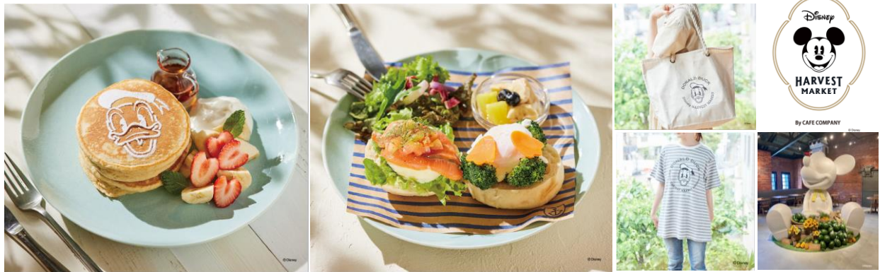
<モーニングメニュー・ドナルドグッズ・店舗内観 イメージ>

また、同店ではモーニングメニューの提供開始に合わせて、6月9日（金）より朝の営業時間を拡大。土日祝だけでなく平日も10:00からカフェ・グッズショップをお楽しみいただけます。