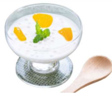
マンゴーサークピアック

カラフルなトッピングが楽しい、タイ風かき氷「ナムケンサイ」。エコフレンドリーなおりがみカップを使用し、提供。