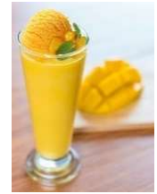
ごろっと果肉マンゴーフロステイ

王室にも認められたプレミアムビール。豊かな味わいが加わったビールは、バランスの取れた味わいです。