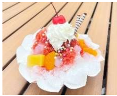
タイ風かき氷 (ナムケンサイ)

カラフルなトッピングが楽しい、タイ風かき氷「ナムケンサイ」。エコフレンドリーなおりがみカップを使用し、提供。