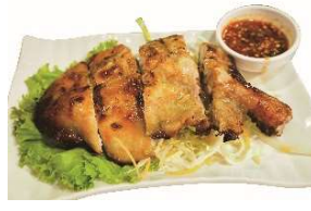
鶏もも丸ごとガイヤーン

グリーンカレーとキーマカレーのいいとこ取りをした、バジルの風味がふわっと香るオリジナルカレーに鮮やかな夏野菜を添えました。