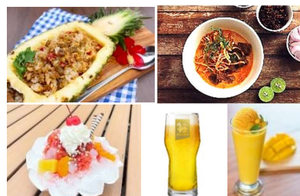
<提供メニューイメージ>