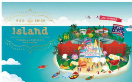
<イベントキービジュアル>

本イベントは、海を望む開放的なロケーションを活かし、横浜にいながら異国情緒な気分を味わえる夏季限定イベントとして2011年から開催し、今年で11回目となります。「アメリカの西海岸」や「アフリカ」など毎年テーマを変えて開催しており、例年会期中には約80万人が来場し、夏の風物詩としてご好評をいただいております。今年は「タイ」をテーマに、「パタヤ」エリアをイメージした歓楽街とリゾートアイランドの2つに分けた会場レイアウトで、エキゾチックな夏をお楽しみいただけます。