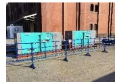
<GTL 燃料発電機イメージ>