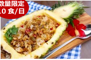
贅沢パインアップルガパオ

パインアップルをそのまま器にした、スパイシーなエスニックガパオライス。南国リゾート気分が楽しめます。