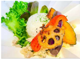
タイ風 夏野菜のグリーンキーマカレー

グリーンカレーとキーマカレーのいいとこ取りをした、バジルの風味がふわっと香るオリジナルカレーに鮮やかな夏野菜を添えました。