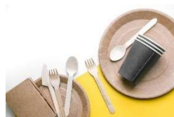
<脱プラスチックイメージ>

横浜みなとみらい 21 地区の「脱炭素先行地域」の取り組みに参画する施設として、フードメニューの容器・カトラリーを非プラスチック製品に切り替え、脱プラスチックを推進するほか、イベントで使用する電力を「GTL 燃料」で発電することによる CO2 排出対策を行うなど、サステナビリティ活動に取り組みます。