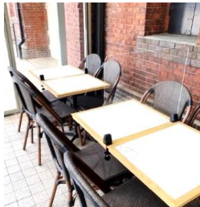
<パーテーション設置中の様子>