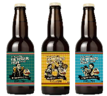
<オリジナルデザイン瓶ビールイメージ>