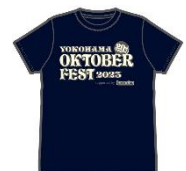
<オフィシャルTシャツイメージ>