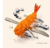
< Fry to Fly Project >