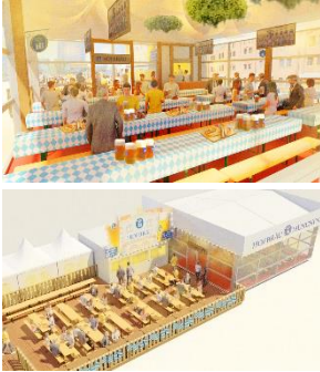
< ブースイメージ >

本場ドイツのオクトーバーフェストの会場をイメージしたコンセプトブース。1589年に宮廷醸造所として創設され、王室が愛した伝統のビール「ホフブロイ」が楽しめます。座席の予約も可能で、ゆったりとお食事を楽しむことができます。ドイツビール「ホフブロイ」の飲み放題プランもご用意しています。※詳細は特設サイトをご確認ください。