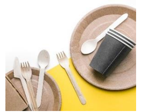
< 脱プラスチックイメージ >

*「Fry to Fly Project」とは：家庭や店舗などで排出される廃食用油から航空燃料の SAF（Sustainable Aviation Fuel）を製造し、その燃料を利用した航空機が飛び世界を実現するプロジェクト。従来の航空燃料に比べて CO2 の排出量をおよそ 80%削減することができます