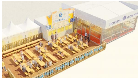
＜「HOFBRÄU」コンセプトブースイメージ＞