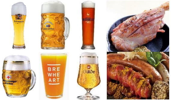
＜販売メニューイメージ＞