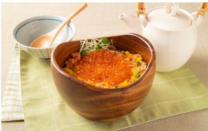
<当館限定メニューイメージ>

横浜赤レンガ倉庫では、創作だし茶漬け専門店「こめらく みんなで、お茶漬け日和。」を、2023年11月29日（水）に横浜赤レンガ倉庫2号館1階フードコートにオープンいたします。