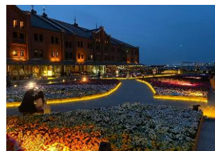
イメージ（過去開催の様子）

夜間（17:30～21:00）は「ムーンライト」をテーマに、より幻想的なライトアップをお届け。月の光がこぼれ落ちるガーデンをイメージし、花畑や道を暖かい光で照らします。明るく周囲を照らすフラワーアーチから「イマーシブエリア」に入ると、不思議な森の世界観にマッチするどビットカラーの光る花が出現。ライトアップも花壇の中から道を照らすことで妖艶な雰囲気。そして、辿りついた先にはシンボルツリーが恍惚と輝きます。次の「リラックスエリア」では雰囲気が変わり、動物たちのオブジェがやさしい光で出迎えます。昼間の「フラワーガーデン」とは異なる幻想的な光の演出をお楽しみください。