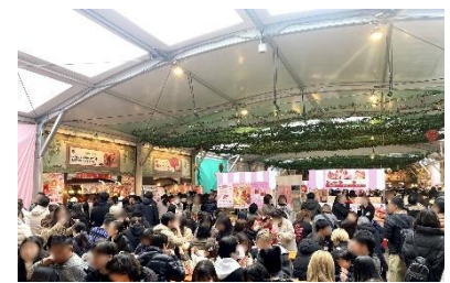
▶2024年2月開催「Yokohama Strawberry Festival 2024」の様子