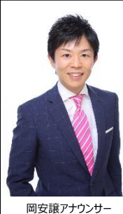
岡安譲アナウンサー

イベントの公式アンバサダーには、関西テレビの岡安譲アナウンサーと橋本和花子アナウンサーに決定！