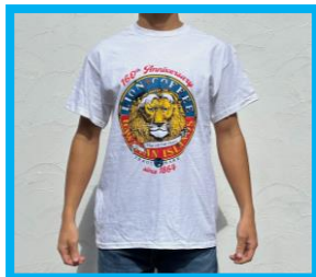
＜Pick the Hawaii＞

南房総・館山にあるオーシャンフロントの店舗はカフェも併設、とにかく1年中夏、1年中ビーチリゾートがテーマの店です。