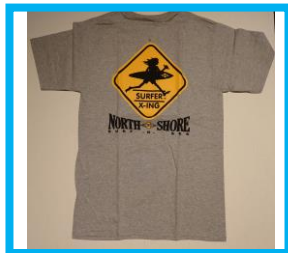
＜サーフアンドシー＞

オアフ島ハレイワのシグニチャーストア「Surf 'NSea」が限定出店いたします。現地ではか手に入らない定番商品や本年度の新作を空輸してお届けいたします。