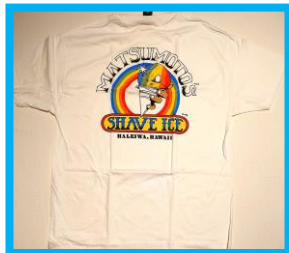
＜マツモトシェイプアイス＞

オアフ島ハレイワのシグニチャーストア「Surf 'NSea」が限定出店いたします。現地ではか手に入らない定番商品や本年度の新作を空輸してお届けいたします。