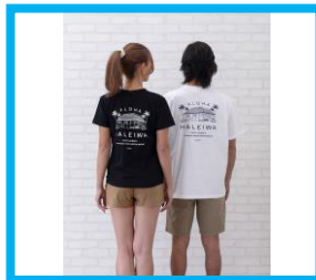
＜Haleiwa Happy Market＞

オアフ島ハレイワのシグニチャーストア「Matsumotoshaveice」の定番商品、新作商品を空輸し販売いたします。当イベントでの地域及び期間限定で円安前の価格にて販売いたします。