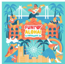
＜メインビジュアル＞

2024年7月12日（金）から15日（月・祝）まで横浜赤レンガ倉庫で開催される新しいハワイイベント「FUN! ALOHA! 2024 in YOKOHAMA」。