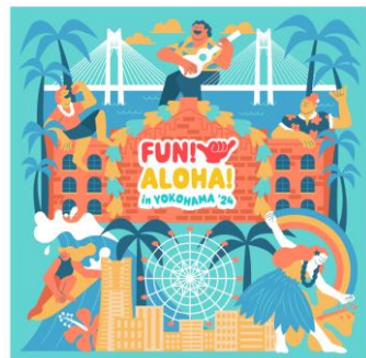
<メインビジュアル>

常に私が作品を作るうえで意識しているテーマは、ハワイの活気ある「アロハ・スピリット」です。ハワイにいる人も、海を越えて遠くにいる人も、気持ちはひとつになれるという想いをこめています。