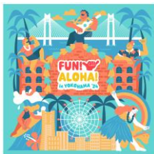
<メインビジュアル>

2024年7月12日（金）から15日（月・祝）まで横浜赤レンガ倉庫で開催される新しいハワイイベント「FUN! ALOHA! 2024 in YOKOHAMA」。 横浜とハワイは140年以上の繋がりがあり、これまでも横浜では数多くのハワイイベントが行われてきましたが、2024年、また一つ新しいハワイイベントが誕生します。 「FUN! ALOHA! 2024 in YOKOHAMA」は、ステージでフラ・ウクレレを観て、キッチンカーエリアでハワイアンフードやドリンクを堪能し、マーケットでアパレルやアクセサリーのショッピングを楽しみ、横浜にいなからハワイを体感できるイベントです。