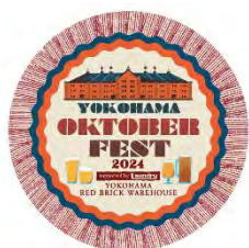
限定ステッカーイメージ

横浜赤レンガ倉庫イベント公式アプリでは、イベント会場で使えるおトクなクーポンを GET できるほか、会場内の一部メニューをアプリから注文・決済できるモバイルオーダーシステムもご利用いただけます。さらに先着でイベント限定ステッカーがもらえるスタンプラリーも開催します。詳細は横浜赤レンガ倉庫イベント公式アプリをご確認ください。