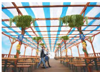
ウッドデッキエリアイメージ

昨年から座席数を増やした全天候型のテントエリアと、海風を感じられる開放的な空間が魅力のウッドデッキエリアがあり、テーブル席ではご家族・仲間同士で、カウンター席ではお一人様やカップルでもゆったりお過ごしいただけます。ブース内は本場オクトーバーフェストの会場をイメージし、ミュンヘンのホフブロイの象徴であるホップを各所に装飾。ほのかなホップの香りまで再現します。また、ウッドデッキエリアは木製パーゴラと緑で、涼しげなガーデンレストランを演出します。