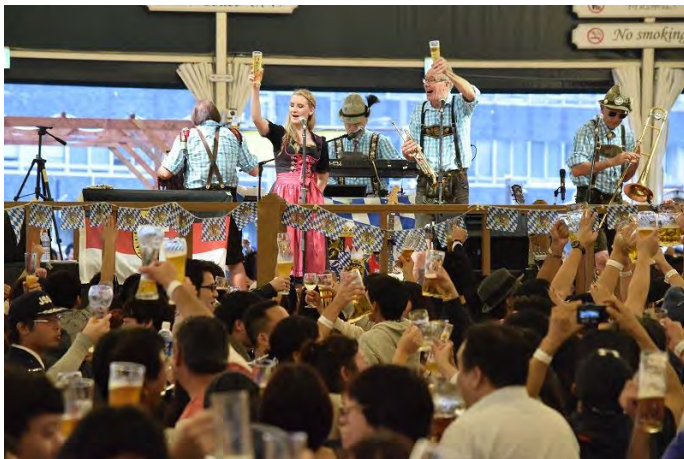
ドイツ楽団の演奏（過去開催時）

横浜赤レンガ倉庫では、2024年9月27日(金)から10月14日(月・祝)の計18日間、横浜赤レンガ倉庫イベント広場に『横浜オクトーバーフェスト 2024』を開催します。