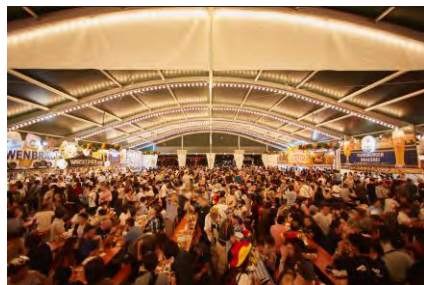
大型テント内イメージ