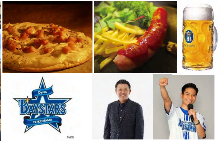
「ホフブロイ」ブースメニュー一例・コンテンツイメージ

本イベントは、本場のドイツ・ミュンヘンに限りなく近い雰囲気を楽しめるオクトーバーフェストとして2003年から開催し、横浜の“秋の風物詩”としてご好評いただいている横浜赤レンガ倉庫の代表的なイベントの一つです。今年も“日本初上陸”、“会場限定”等の貴重なビールをはじめ、本格的なドイツビールや地ビール等、全100種類以上のビールをご用意し、オクトーバーフェスト名物でもあるドイツ楽団の生演奏やグルメとともに堪能いただけます。