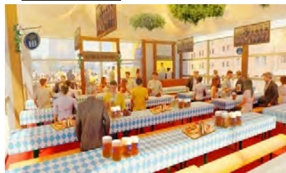
テントエリアイメージ