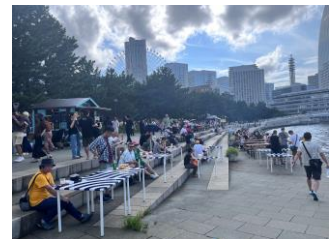
< 前回の様子 >