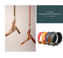
< くすのき犬具 >

お洋服や雑貨をセミオーダーハンドメイドにて制作しております。愛犬の体型に合わせてお仕立て調節可能です♪