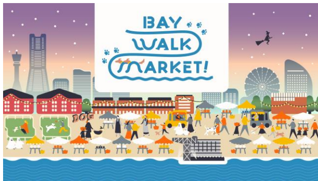
<イベントキービジュアル>

※横浜赤レンガ倉庫エリアの「ドッグラン」「フォトスポット」は、10月11日（金）からオープン