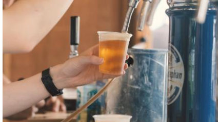
< 過去の様子 >