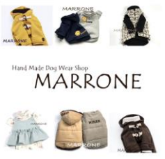
< MARRONE >

高品質な本革製品や犬服を展開。選りすぐりの素材と美しいデザインで、愛犬とのお出かけを一層上の体験へ。