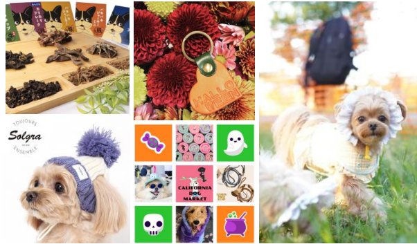
<会場・販売グッズイメージ>

横浜みなとみらい新港地区の臨海部に面する横浜赤レンガ倉庫、MARINE & WALK YOKOHAMA、横浜ハンマーヘッド、DREAMDOOR YOKOHAMA HAMMERHEADの4施設を結ぶ横浜みなとみらい新港地区の水際プロムナードで、2024年10月12日（土）から14日（月・祝）の計3日間、今回で8回目となる『BAY WALK MARKET 2024』を開催します。海沿いの開放的な空間でお散歩しながら楽しめるマーケットとして、昨年は約20万人のお客様にご来場いただきました。