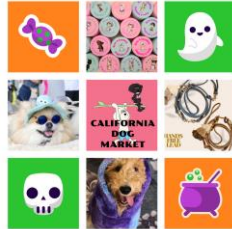
< CALIFORNIA DOG MARKET >

岡山県食肉市場から直接仕入れた新鮮なお肉を丁寧に手作した安心安全・完全無添商品です!