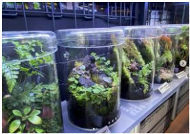
<FLORESTA (アクアリウムショップ)>

世界各国から新たな特徴を持つ個体が登場し続け、まだまだ底が見えない珍奇植物の本イベント限定販売を是非お楽しみください。