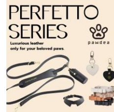
< pawdea >

WAN VOYAGEはワンちゃんのお洋服のお店です。ニット帽やおもちゃも多数ご用意しております。