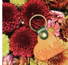
< アトリエ正樹 >

オリジナルリードやカフェマットにインポートのセレクトアパレルで愛犬とお洒落を楽しんでください!