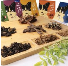
< リトル・ヘブン >

昨年秋、みなとみらいエリアを仮装したワンちゃんに埋め尽くしたイベント「ハロウィンドッグパーティー」を今年も開催! 特設ドッグランや、約120店舗が揃うドッグマーケットを展開。夜はイルミネーションが灯り、仮装したワンちゃんと心地よい秋の海辺を楽しむことができます。