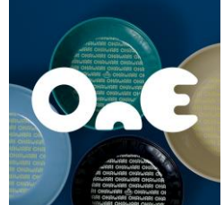
< OnE >

人とペットを繋ぐカラフルでポップな商品を販売しております。一点ずつこだわった商品です。