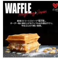
< Glades Kitchen >

香港スタイルのワッフル「格仔餅」。オーダー毎に焼きあげるワッフルに、様々な具材を挟んで、外はカリカリ中はふんわり軽い食感です。