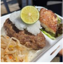
< PARLOR ZONO >

MARINE & WALK YOKOHAMAエリアでは一杯ずつハンドドリップで淹れるスペシャルティコーヒーをご提供するカフェ「WEEKEND」や、香港スタイルのワッフルを展開する「Glades Kitchen」など多種多様な15 店舗のキッチンカーが登場し、さながら屋外のフードコートのように！