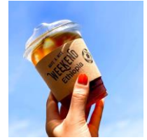
< WEEKEND >

香港スタイルのワッフル「格仔餅」。オーダー毎に焼きあげるワッフルに、様々な具材を挟んで、外はカリカリ中はふんわり軽い食感です。