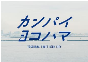
<「カンパイヨコハマ」キービジュアル>

横浜発のビールを最高のロケーションで一堂に楽しめる好評企画、「カンパイヨコハマ」をDREAMDOORエリアにて開催。ビール発祥の地、横浜では2024年9月現在、市内に14か所ものブルワリーがクラフトビールを製造しています。その中でも特にみなとみらい、馬車道、関内の徒歩圏内で7社ものクラフトビールメーカーが軒を連ねており全国でも稀に見るクラフトビール集積拠点となっています。本イベントでは各社のクラフトビール常時約28種類をご提供いたします。さらに今回もDJブースを設置し、音楽を楽しみながらクラフトビールが味わえます。