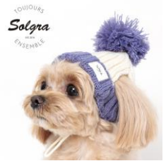
< WAN VOYAGE >

人とペットを繋ぐカラフルでポップな商品を販売しております。一点ずつこだわった商品です。