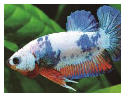
<水作 (アクアリウムメーカー)>

老舗アクアリウムメーカーが初出店。ブースでは現地タイでセレクトした超希少なショーベタを多数販売。あなたの推しカラーの1匹を見つけて下さい。さらに人気の【ハンギングプランター】でつくるワークショップを予定しています！