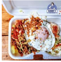
< Kimmy's Deli >

牛肉100%の粗挽きハンバーグ！隠し味に味噌とマヨネーズを使用。食べればほろりと崩れる食感は絶妙！