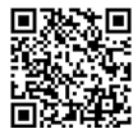
YUSF '23 Playlist